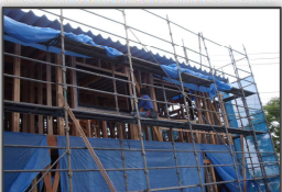
足場の組立て等特別教育

現場の安全管理から足場の組み立て等、住宅の施工に必要な、安全に関するあらゆる知識や技能を学びます。また、安全管理に必要な各種技能講習（以下）を受講し、資格を取得します。