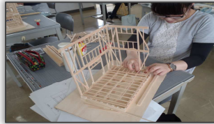
模型をつくり構造を学びます