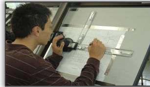
手描きによる製図を学びます